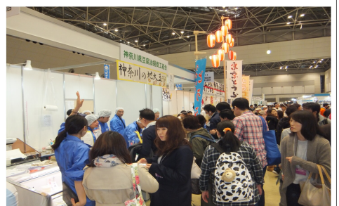
来場者で賑わう当ブース前

初日、11/23(日)の日程終了後17:30より、出展者や関係者を交えた総勢200名にも及ぶ大懇親会「SOYFESTAナイト」が会場内イベントブースにて開催されました。写真(左)